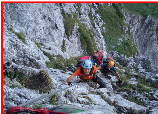
Passaggio sulla ferrata

Tutti gli iscritti sono tenuti a partecipare alla riunione pregita Venerdì 6 ottobre in sede per tutte le informazioni necessarie (grado di difficoltà, abbigliamento, attrezzatura, organizzazione e viaggio).