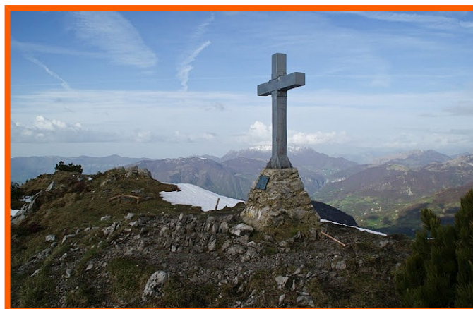
Croce di vetta del monte Cancervo

Tutti gli iscritti sono tenuti a partecipare alla riunione pregita Venerdì 13 ottobre in sede, per tutte le informazioni necessarie. (Grado di difficoltà, abbigliamento, attrezzatura, organizzazione e viaggio). Per cause di forza maggiore la gita potrà essere modificata o annullata. Per i NON SOCI è obbligatoria l'assicurazione.