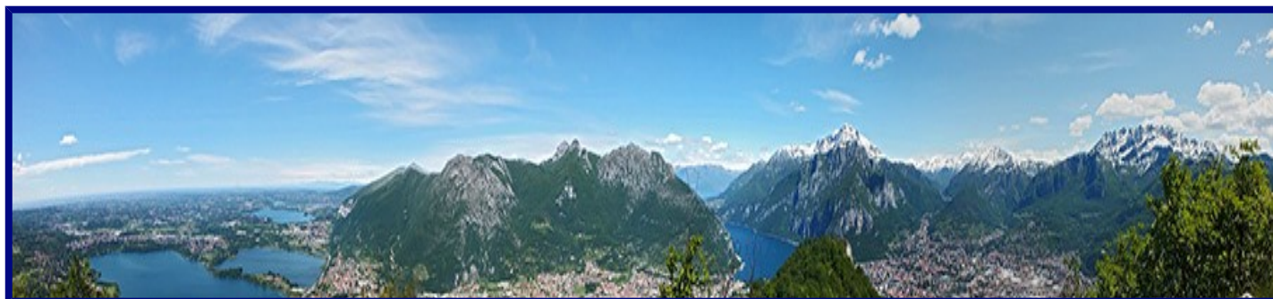
Vista spettacolare dalla vetta

Tutti gli iscritti sono tenuti a partecipare alla riunione pregita Venerdì 20 aprile in sede, per tutte le informazioni necessarie. (Grado di difficoltà, abbigliamento, attrezzatura, organizzazione e viaggio).