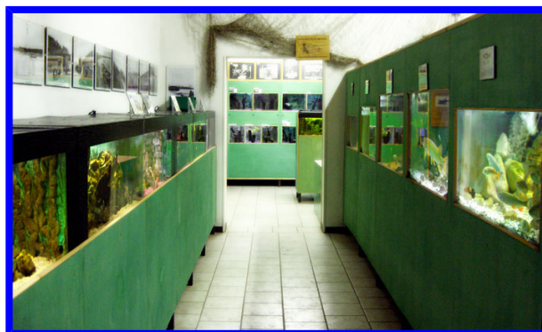
Acquario di Motta Baluffi

Tutti gli iscritti sono tenuti a partecipare alla riunione pregita Venerdì 4 maggio in sede, per tutte le informazioni necessarie. (Grado di difficoltà, abbigliamento, attrezzatura, ORGANIZZAZIONE, VIAGGIO E BIGLIETTI). Per i NON SOCI è obbligatoria l'assicurazione.