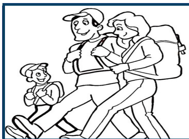
Gita adatta a tutti

Tutti gli iscritti sono tenuti a partecipare alla riunione pregita Venerdì 18 maggio in sede, per tutte le informazioni necessarie. (Grado di difficoltà, abbigliamento, attrezzatura, organizzazione e viaggio).