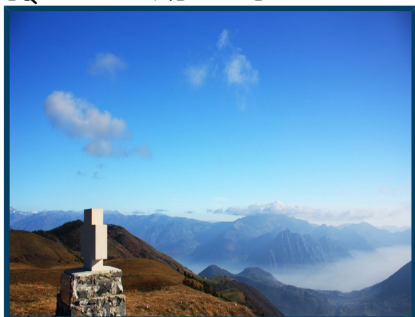
Veduta dalla vetta