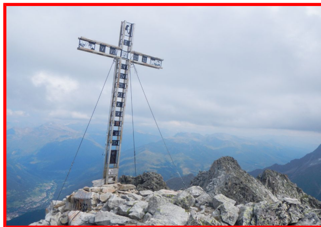
Croce di vetta Cima SALIMMO

Tutti gli iscritti sono tenuti a partecipare alla riunione pregita Venerdì 6 luglio in sede, per tutte le informazioni necessarie. (Grado di difficoltà, abbigliamento, attrezzatura, organizzazione e viaggio).