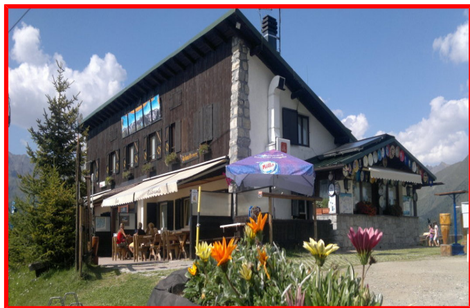
Rifugio Petit Pierre m. 1890

Bella gita senza difficoltà ma che richiede passo fermo e sicuro. Dopo aver raggiunto il Rifugio Petit Pierre su sentiero ci dirigiamo alla Conca di Pozzuolo, seguiamo il segnavia per la cima Salimmo restando al centro della valle e puntando all'evidente bocchetta di cresta (40/45°), raggiungiamo la bocchetta di Valbiona da cui possiamo vedere la croce di vetta. Da qui seguiamo i segnavia verso sinistra e risaliamo per roccette e cenge esposte un forcellino. Seguiamo la traccia tra sassi e detriti e, dopo aver visto l'uscita del canalone delle pala ghiacciata, presumibilmente su neve, con passaggi di 1° grado, raggiungiamo la croce di vetta. Per la discesa faremo a ritroso lo stesso itinerario di salita.