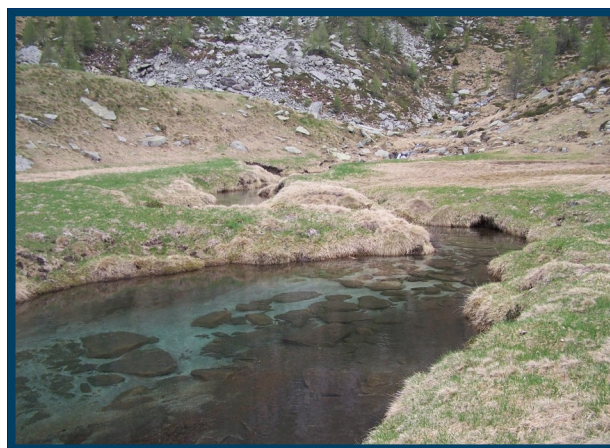
Torrente a malga Retorti

Tutti gli iscritti sono tenuti a partecipare alla riunione pregita Venerdì 14 settembre in sede, per tutte le informazioni necessarie. (Grado di difficoltà, abbigliamento, attrezzatura, organizzazione e viaggio).