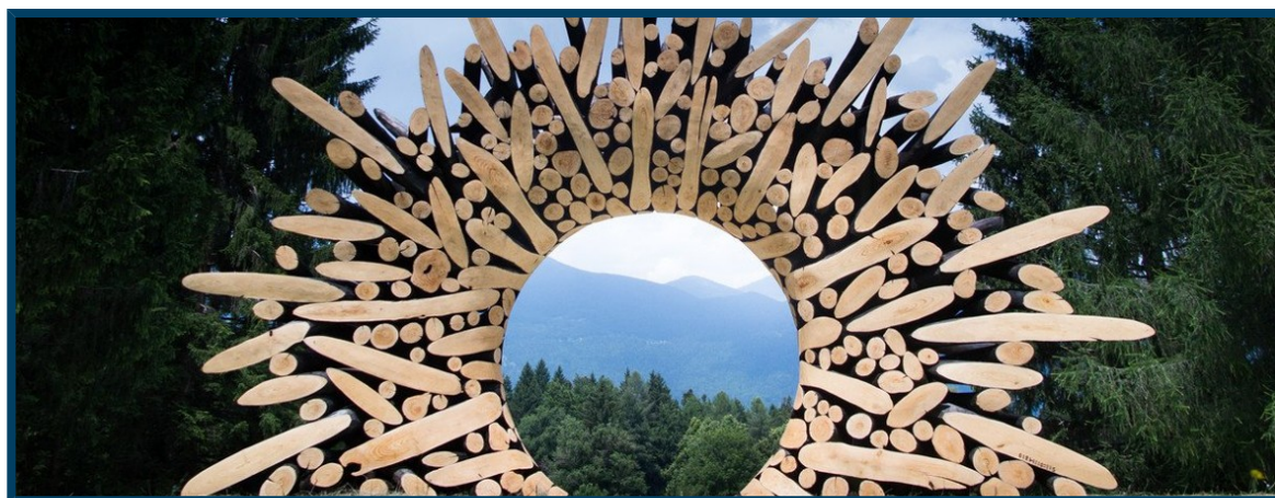
Installazione ad ARTE SELLA

ABBIGLIAMENTO: sono necessarie scarpe comode.