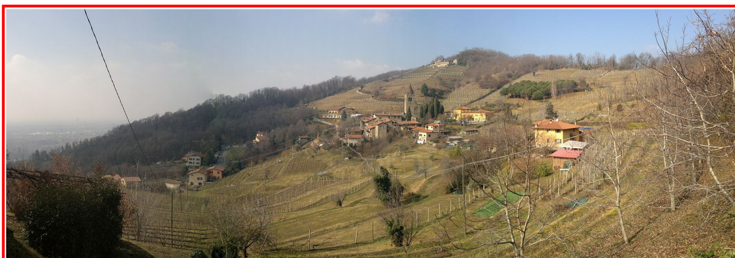
Veduta del borgo di Fontanella

ABBIGLIAMENTO: Media montagna EQUIPAGGIAMENTO: Escursionistico.