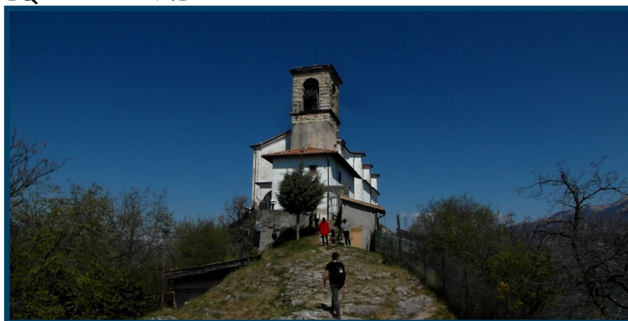
Santuario Madonna della Ceriola