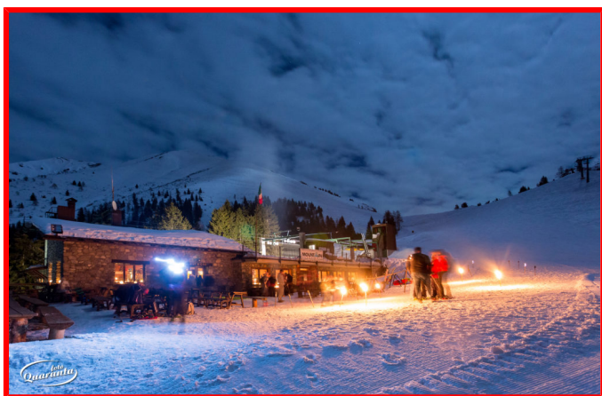
Rifugio Vodala m. 1635

RITROVO presso sede CAI a Romano di Lombardia alle ORE 17.00