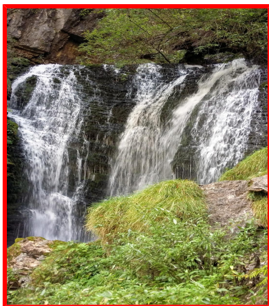
Sorgenti fiume Enna

Abbigliamento ed Equipaggiamento: da escursionismo