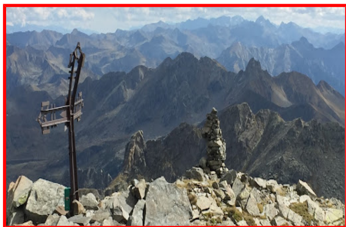
Vetta Pizzo di Trona

Si parte dalla curva degli Sciòcc situata sulla strada provinciale (a pagamento € 2.00) che porta ai piani dell'Avaro. Seguire il sentiero 108 fino alla deviazione per il sentiero dei Vitelli (107A) e, passando sotto il rifugio Benigni, si arriva al passo bocca di Trona. Ci si dirige verso il lago Rotondo e, stando a mezza costa, si sale verso il versante est del Pizzo di Trona, (difficoltà di II grado). Dalla cima si scende dal versante nord utilizzando il cavo di sicurezza (placche verticali) verso il lago dell'Inferno. Il ritorno potrà avvenire o costeggiando il lago dell'Inferno salendo alla bocchette dell'Inferno o dalla valletta del lago Zancone. Risaliti al passo di bocca di Trona si ritorna sul percorso dell'andata fino alla località Sciòcc.