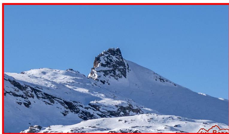
Cima Fellaria in invernale

Tutti gli iscritti sono tenuti a partecipare alla riunione pregita venerdì 27 agosto in sede, per tutte le informazioni necessarie: ( COVID 19 , grado di difficoltà, abbigliamento, attrezzatura, organizzazione e viaggio).