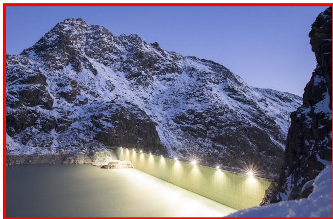
Diga Alpe Gera

Dal parcheggio alla diga di Gera si raggiunge in circa un'ora il rifugio Bignami. Poi seguendo le indicazioni per la bocchetta di Caspoggio si raggiunge l'alpe Fellaria e, su sentiero ben segnato, si prosegue nella piana valliva con direzione WNE. Ora si risalgono ripidi pendii ghiaiosi e si raggiunge una larga conca ove in passato vi era un piccolo ghiacciaio. Da qui si raggiunge un valico con un grosso ometto in pietre e si scende sul versante opposto dove inizia il ghiacciaio. Si aggira la crepaccia terminale fino a raggiungere la cresta NNE. Ora il percorso è evidente e per facili roccette, canaletti e detriti si giunge al risalto finale. Con rocce gradinate si raggiunge la stretta vetta.