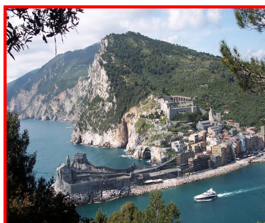
Portovenere vista da Palmaria