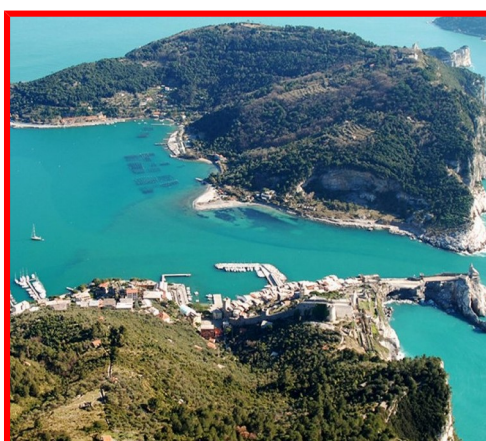
Isola di Palmaria