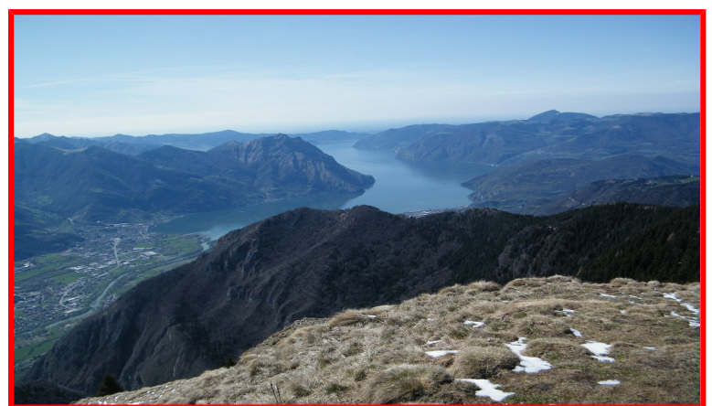
Vista del lago d'Iseo dal monte Alto

Referente della gita Mara Tel. 3472578516